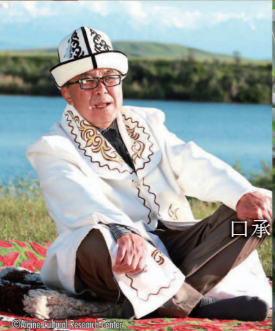
口承による伝統および表現