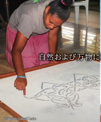
自然および万物に関する知識および慣習